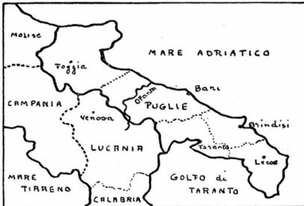
Apulia nostrae aetatis