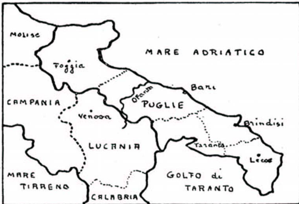
Apulia nostrae aetatis